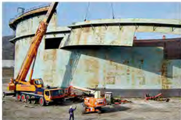
GENTILE AMBIENTE S.p.A.